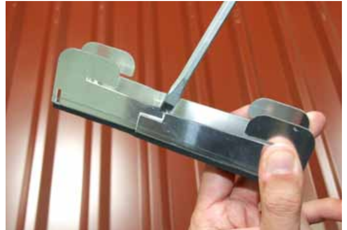
Von oben Schraubendreher in den