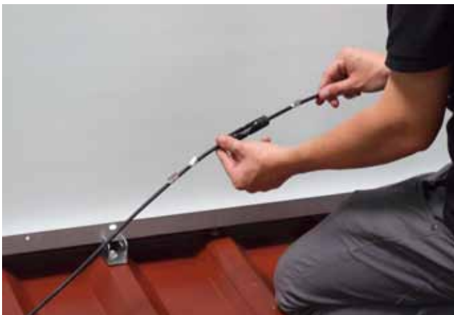
Stringkabel zusammen stecken.