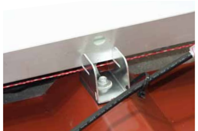
Kabel nach Bedarf fixieren.