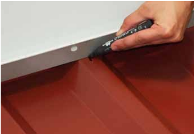
Sicken auswählen und markieren,