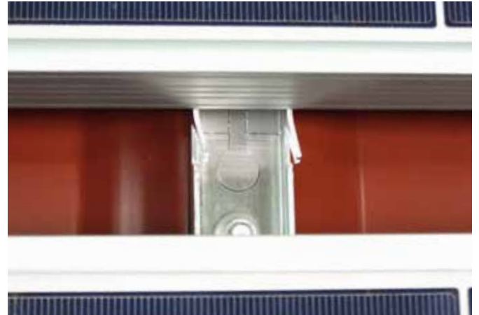
mit Schraubendreher auftrennen.