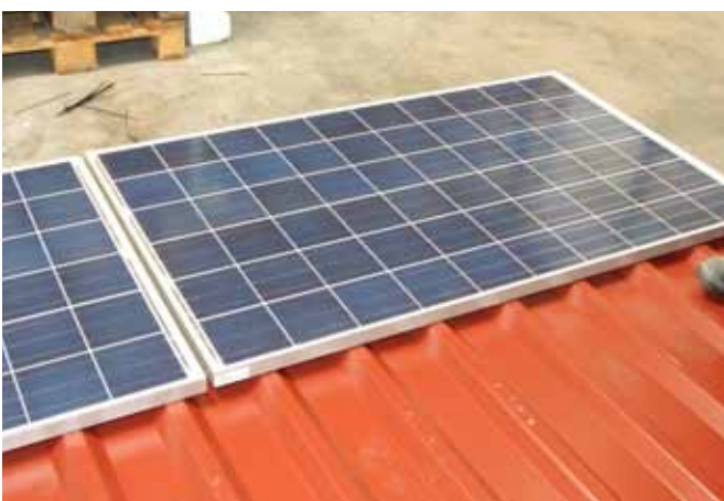
Fertig verlegtes Modul