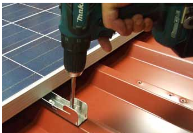
Akkuschrauber mit 8mm Nuss