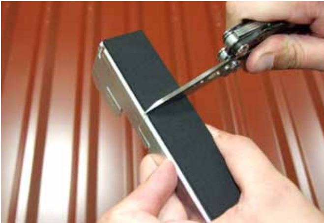
Dichtpad am Stoß aufschneiden.