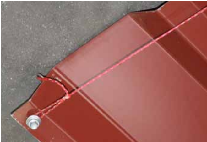
Schnur an Oberkante Modulfeld.