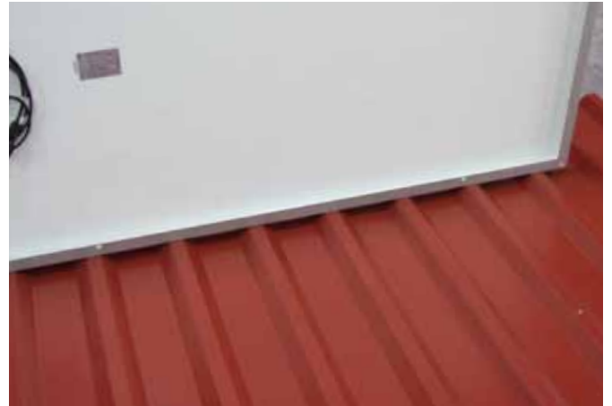
Module grob anordnen.