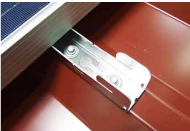
ilzohook fertig verschraubt.