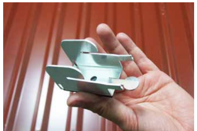
Mit kurzem Teil oben beginnen.