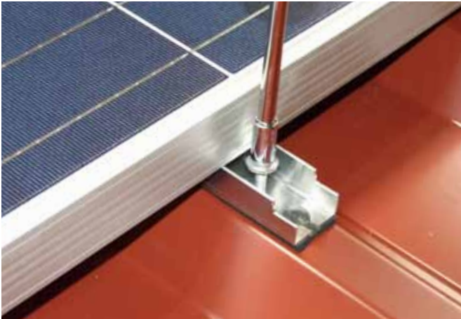
Halber ilzohook am unteren Rand.