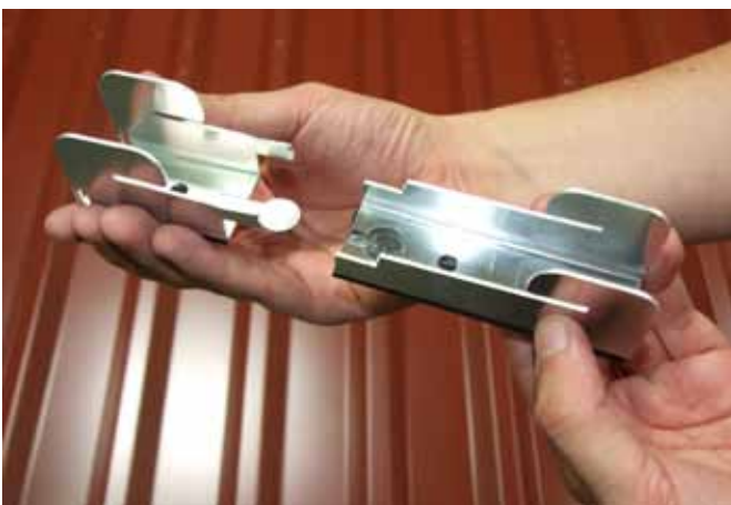
ilzohook auseinander ziehen.