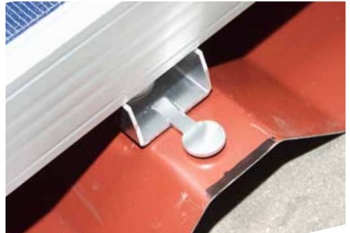
Nasen am oberen Rand abtrennen