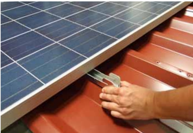
ilzohook in den Rahmen ziehen.