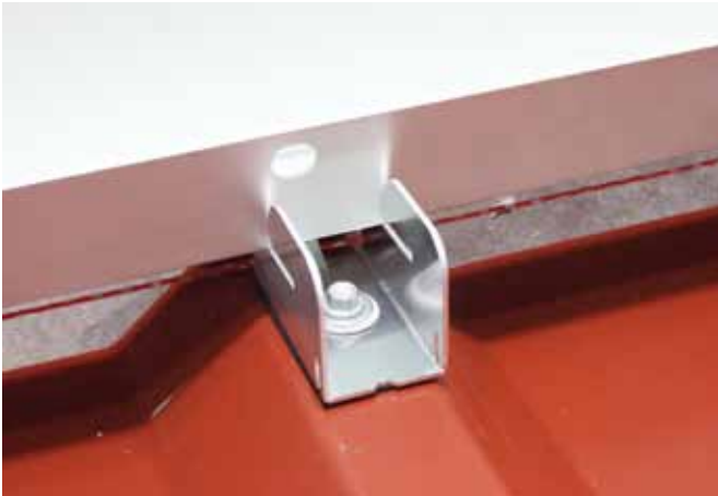
Modul auf ilzohook abstellen.