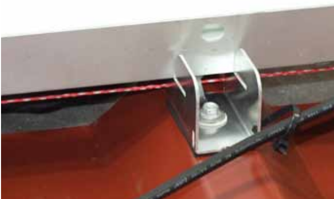
nach Bedarf fixiert am ilzohook