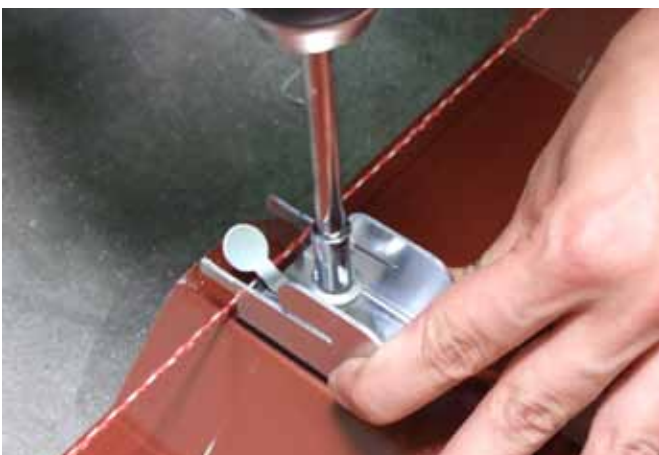
und auf den Hochsicken mit den