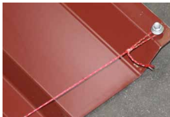
Schnur oder Schnurschlag