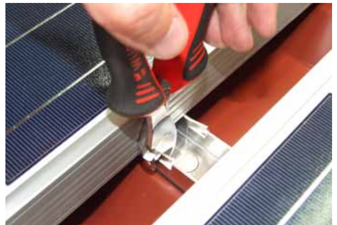
Obere Nasen bündig mit einem