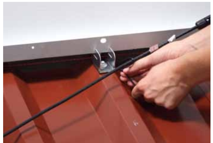
Kabelführung mit Kabelbinder