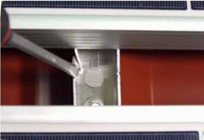
ilzohook unter dem Modul wie vor