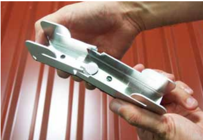
beiden Kerben um 90° aufdrehen.