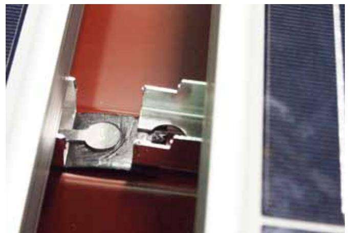
Unterteil mit Modul weg heben.