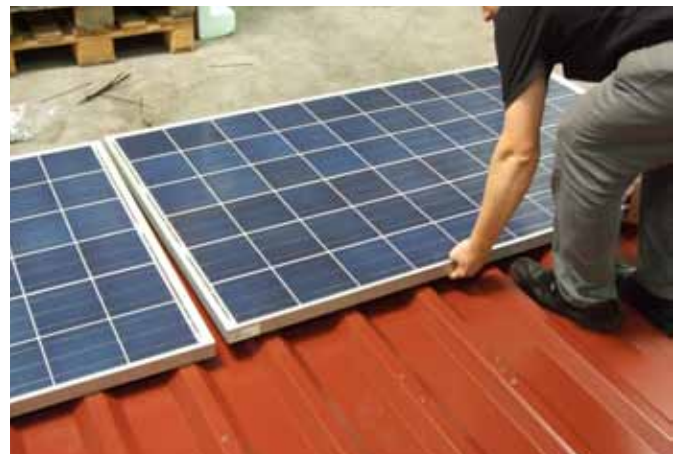
Modul in beide ilzohooks ziehen.