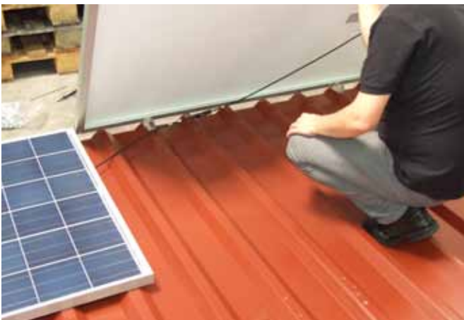
Modul nach unten ablegen.