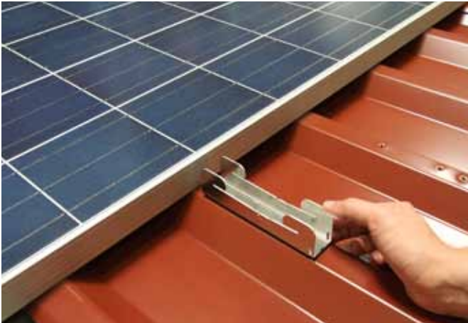
ilzohook an oberes Modul schieben.