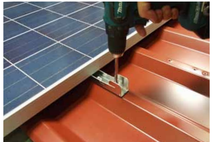
ilzohook komplett verschrauben.