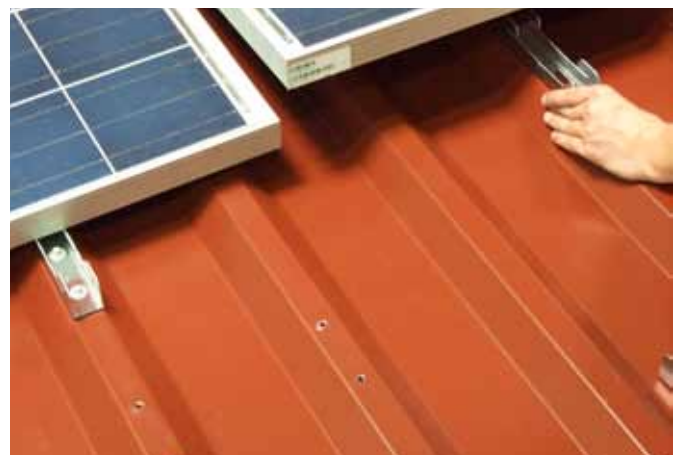
Nächstes Modul in gleicher Weise.