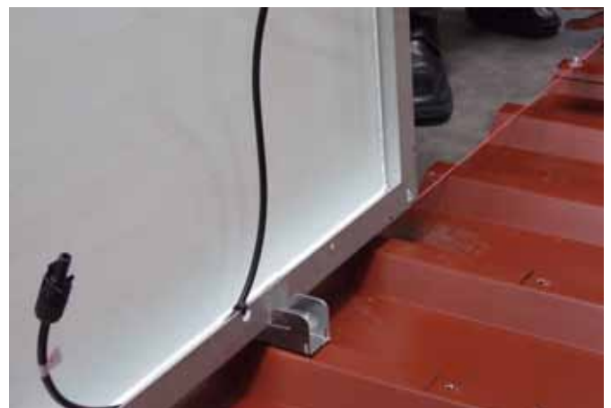
oder Kabel fixiert am Rahmen.