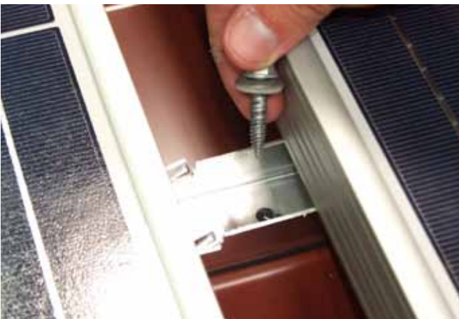
Schraube unter dem Modul lösen.