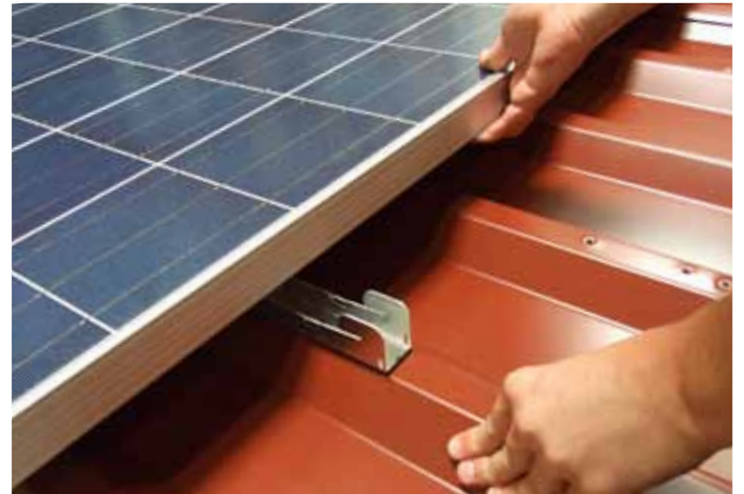
Modulkante vorsichtig anheben.